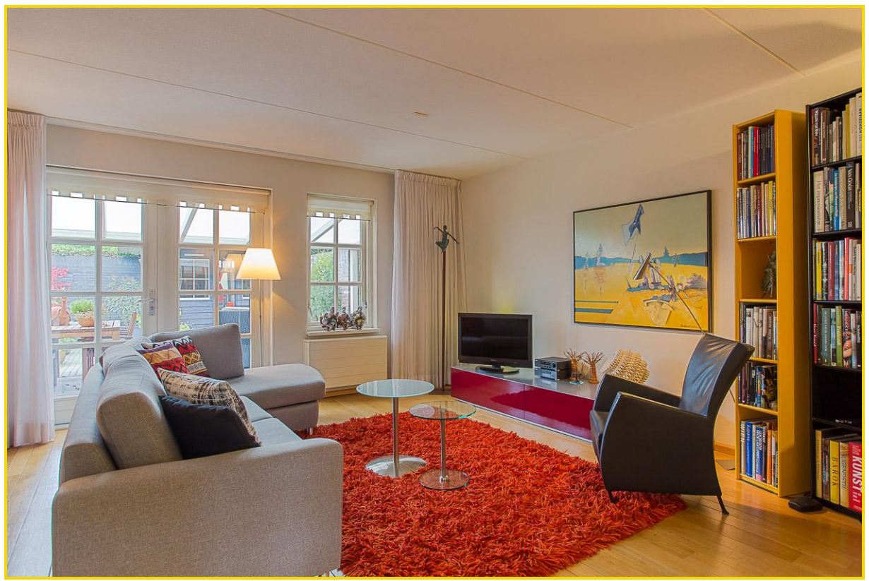
Tuingerichte woonkamer met zit- en eethoek en tuindeuren naar overdekt terras...