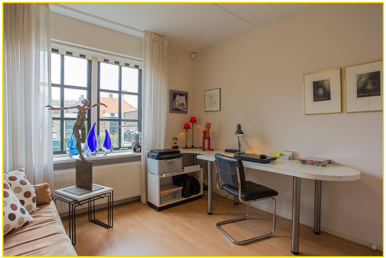
Slaapkamer met eigen ...