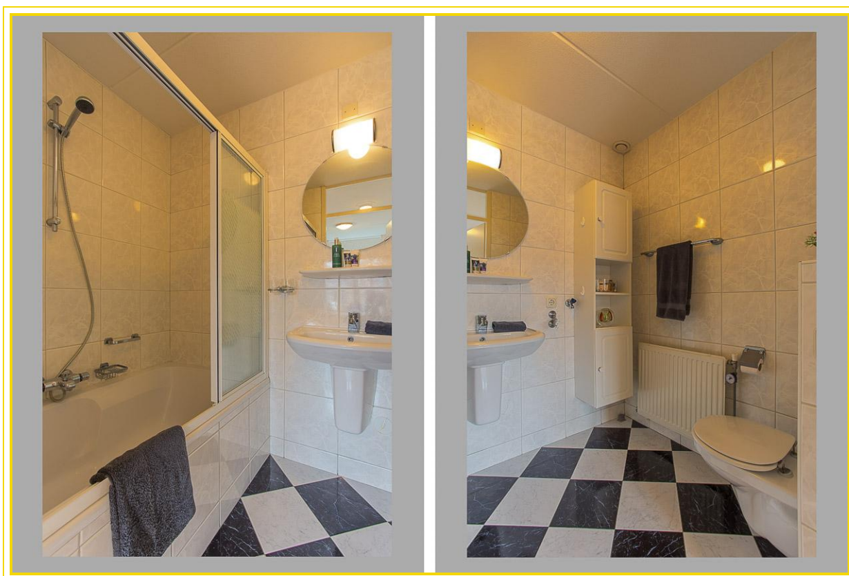
badkamer v.v. ligbad met douche, zwevend toilet en wastafel...