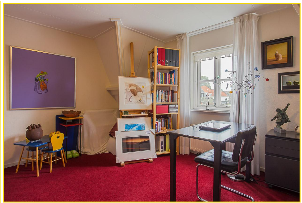
Slaapkamer met ingebouwde kasten en CV kast...