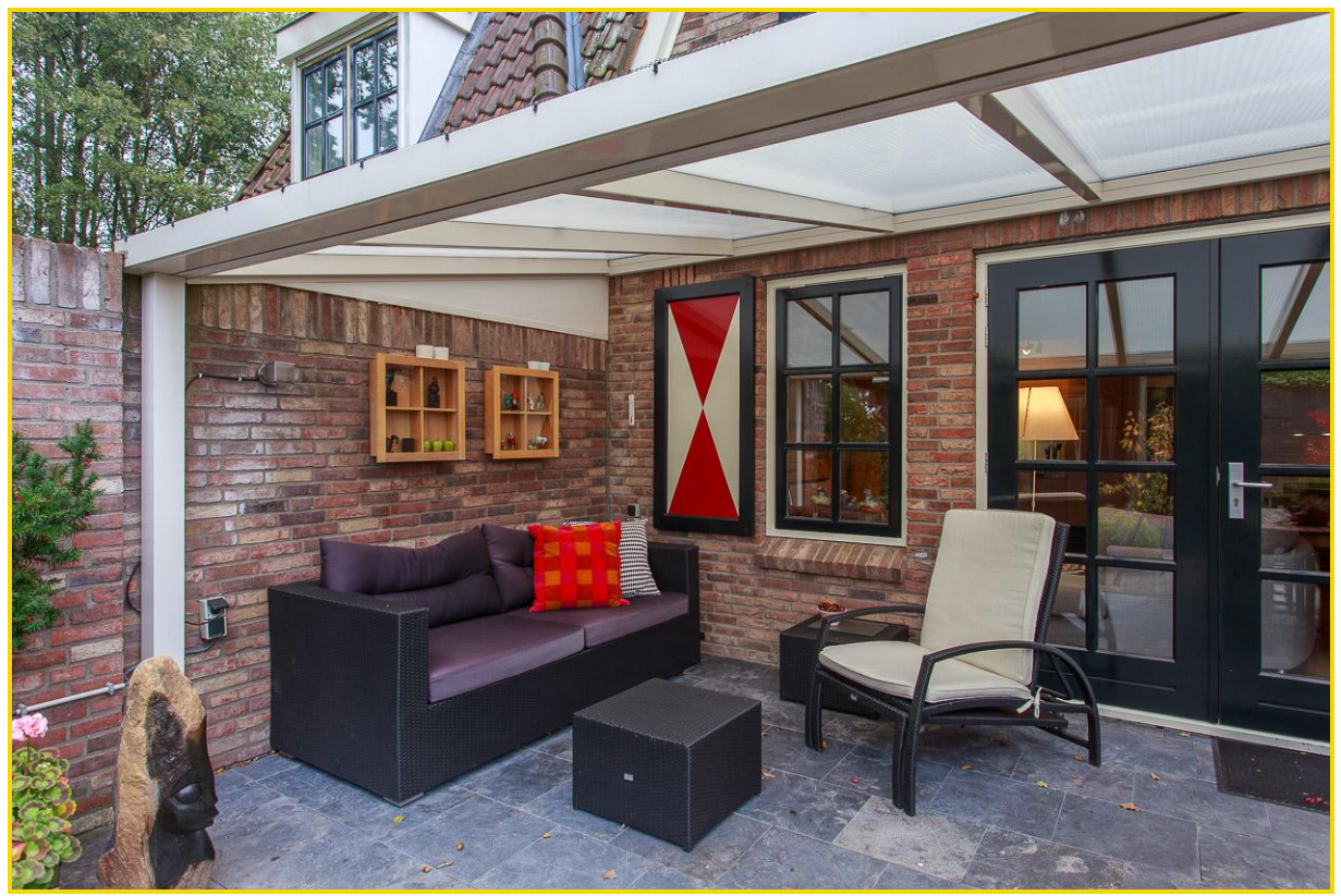
Besloten, verharde tuin op het zuiden met overkapping en veel privacy...