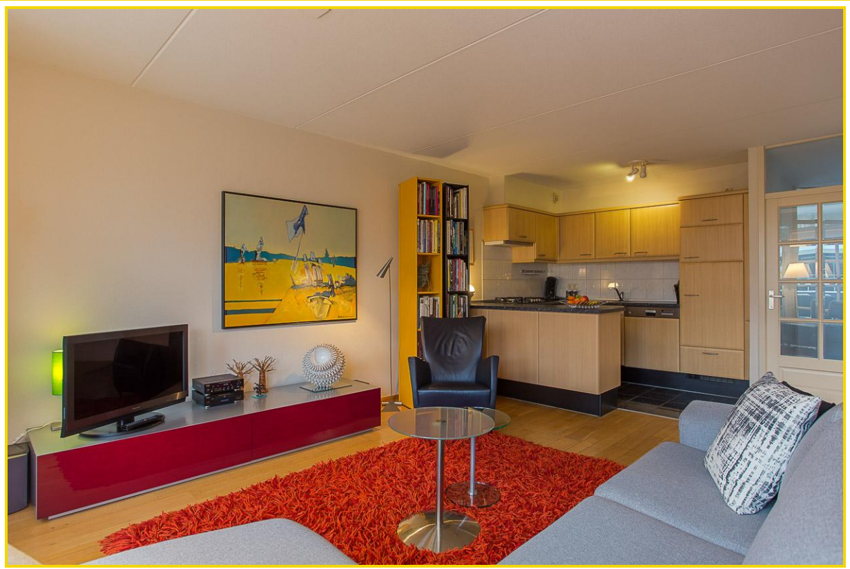
Open keuken v.v. vaatwasser, combi magnetron, koelkast en gaskookplaat...