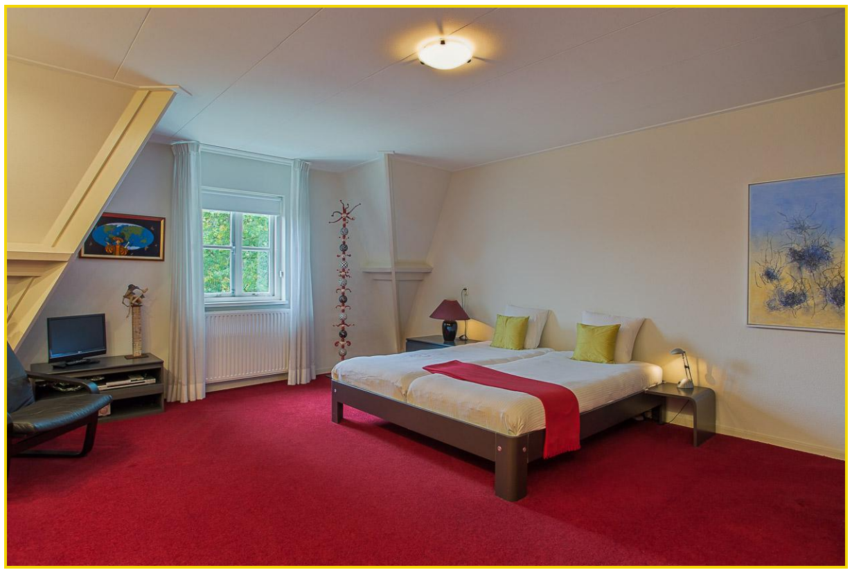
Zeer ruime ouder slaapkamer met ingebouwde kasten...