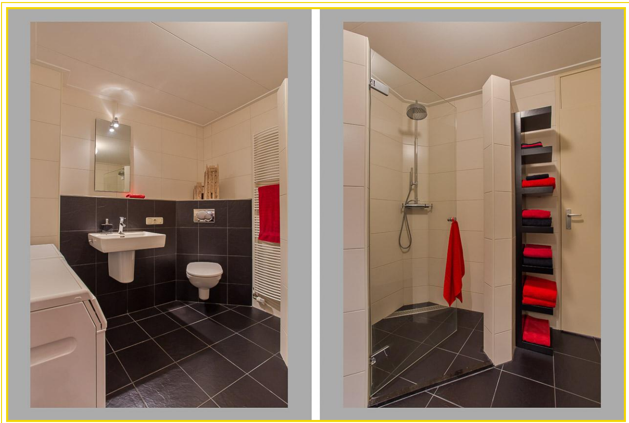
Badkamer (2010) v.v. ruime inloopdouche, zwevend toilet, wastafel met designradiator...